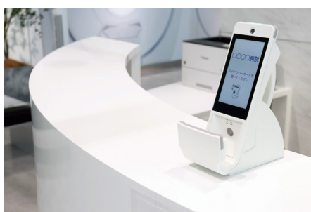
オンライン資格確認向け顔認証付きカードリーダー “Hi-CARA”

キャノンマーケティングジャパン株式会社(代表取締役社長：坂田正弘、以下キャノン MJ)は、「オンライン資格確認」用の顔認証付きカードリーダー “Hi-CARA (ハイカラ)” の提供を、社会保険診療報酬支払基金の医療機関向けポータルサイト経由にて開始します。「オンライン資格確認」は、医療機関・薬局の窓口でマイナンバーカードを使用してオンライン上で保険資格を確認できる仕組みで、2021年3月から運用開始が予定されています。