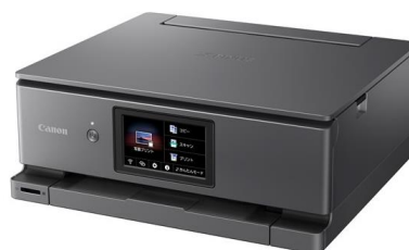
上質感のあるダークシルバーメタリック