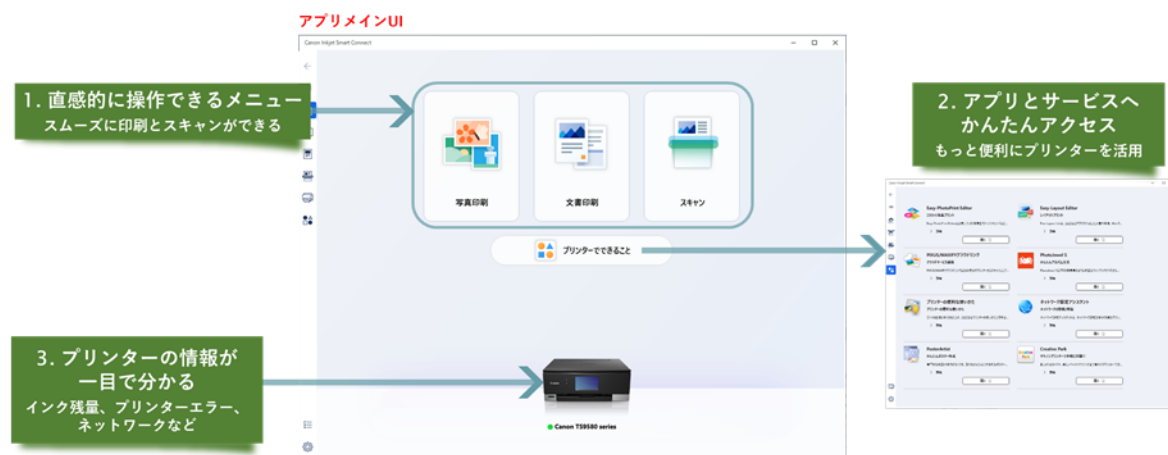
「Canon Inkjet Smart Connect」使用イメージ