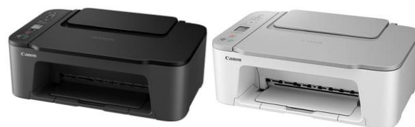
PIXUS TS3530 (ブラック／ホワイト)