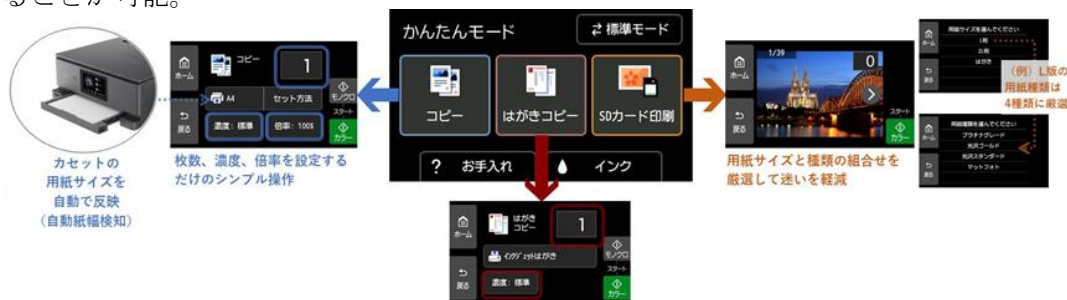
「かんたんモード」使用イメージ