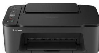
PIXUS TS3530（ブラック／ホワイト）