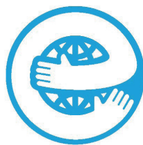
エコマーク認定商品 11135001