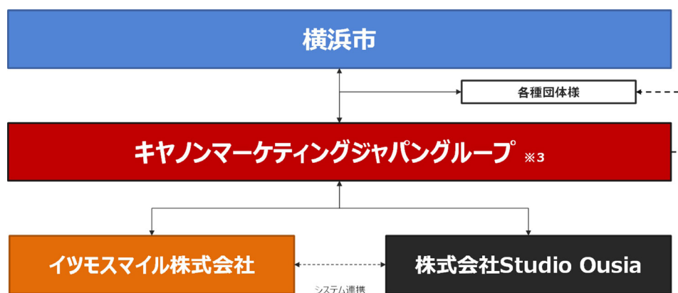
横浜市「市民活動情報のデジタル化に関する実証実験」の体制図

※3 キヤノンMJ：プロジェクトの全体統括、キヤノンビズアテンダ株式会社：アプリケーションの企画・運用サポート