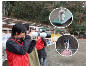
超広角／超望遠レンズを使用して作例を競い合う オンライン企画「作例-1 グランプリ」

「EOS R システム」を中心とした幅広い製品のタッチ＆トライを実施するほか、VR や MR を活用した XR 映像ソリューションを紹介します。また、写真家・映像クリエイターによるプレゼンテーションステージに加え、EOS 学園講師のアドバイスを受けながら撮影体験ができるコーナーなど、初心者からプロ・ハイアマチュアまで楽しめるブースを展開します。なお、プレゼンテーションステージのコンテンツは、オンライン※1でのライブ配信も実施します。