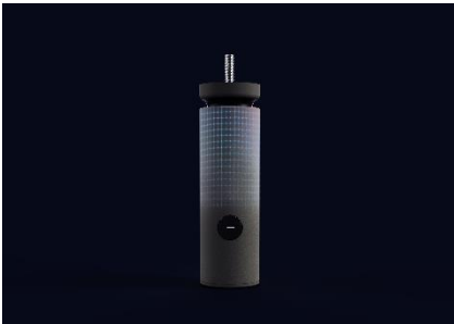
スマートデバイス

Valpas のソリューションは、IoT を活用した独自のトコジラミ誘引・捕獲デバイスとソフトウェアによって、宿泊客にトコジラミのいない安全・安心な滞在を提供します。また、ホテルや旅館のウェブサイトやオンライン旅行代理店（OTA）と連携して「Bed Bug Safe ラベル認証」を示すことで、365 日 24 時間、トコジラミ対策を講じている安心・安全なホテルであることをお客さまへアピールすることができます。世界中の 300 軒以上のホテルに Valpas の「Bed Bug Safe ラベル認証」を提供しており、これによって、導入しているホテルがすべての部屋で Valpas のソリューションを使用していることを保証するとともに、ゲストがトコジラミの被害から守られていることを証明することができます。