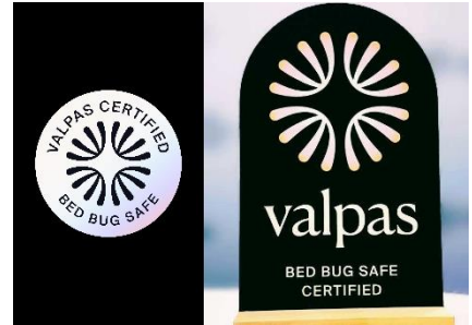
Bed Bug Safe ラベル認証