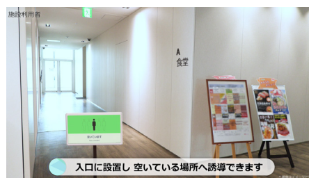
混雑状況通知イメージ

国内において緊急事態宣言は解除されたものの、まん延防止等重点措置が適用されるなど依然として新型コロナウイルス感染症に対する感染拡大防止対策が求められています。特に、多くの人が集まる施設や店舗においては、これまで以上に密集を避ける取り組みの強化が急務となっています。今後は施設運営者による密集回避の対策はもちろんのこと、施設利用者に自発的な行動を促すことも重要です。