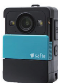
ウェアラブルカメラ