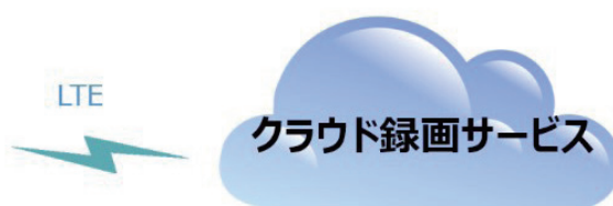
クラウド録画30日プラン