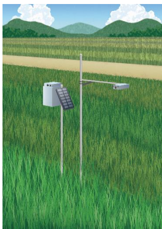
システムの設置イメージ

キヤノンは、作物栽培の効率化や品質向上などを実現する農業ソリューションとして、画像から作物の生育指標を自動で取得することが可能な農業生育モニタリングシステムの実証実験を行っています。