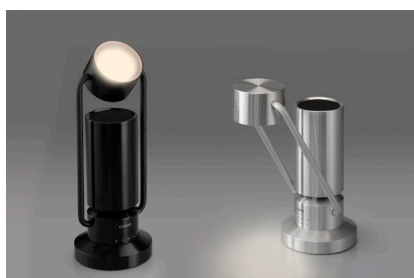
“albos Light & Speaker”

キヤノンマーケティングジャパン株式会社（代表取締役社長：足立正親 以下、キヤノンMJ）は、キヤノン電子株式会社（代表取締役社長：橋本健 以下、キヤノン電子）製のスポットライト型アルミスピーカー“albos Light & Speaker”（アルボス ライト アンド スピーカー）を2022年12月中旬に発売します。また、発売に先駆けて“albos Light & Speaker”を先行体験できる専門店「albos ROOM」（アルボスルーム）を、2022年11月18日（金）～21日（月）の期間限定で、東京・銀座にオープンします。